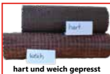
hart und weich gepresst

Tipps zur Verbrennung unserer flambriks finden Sie auf der Rückseite dieser Broschüre.