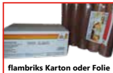
flambriks Karton oder Folie

Außerdem sind unsere Briketts in verschiedenen Holzarten (reine Buche oder Eiche, Buche/Eiche-Mischung (=Hartholz), oder Nadelholz) erhältlich: