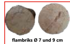
flambriks Ø 7 und 9 cm

Neben unterschiedlichen Durchmessern (7 oder 9 cm) unterscheiden wir die Festigkeit der Pressung (hart oder weich) und die Art der Verpackung (Karton oder Folie).